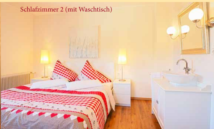
Schlafzimmer 2 (mit Waschtisch)