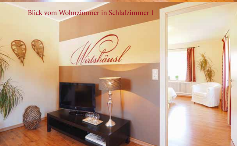
Blick vom Wohnzimmer in Schlafzimmer 1